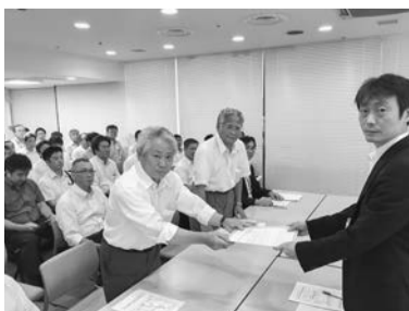
厚労省への要請行動

全建総連では、政府予算が確定する年末ギリギリまで、予算要求運動の強化をはかります。三重建労でも、国会議員要請行動や財務省へのハガキ要請行動などを中心に運動を強化していきます。組合員、ご家族の皆さんの一層のご協力をお願いします。