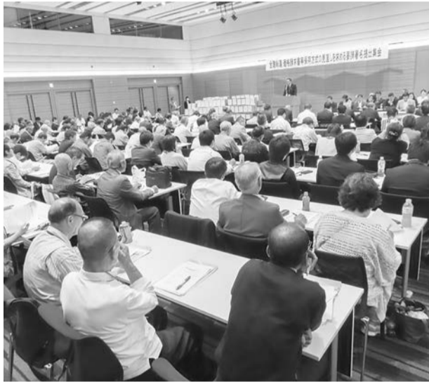
要請署名提出集会に188人が参加

全建総連は、全国で展開してきた「インボイス制度の見直し」および「被災者の住宅再建等の支援」を求める要請署名の提出集会を10月10日、衆議院議員会館で開催。仲間の声を政党等に提出しました。