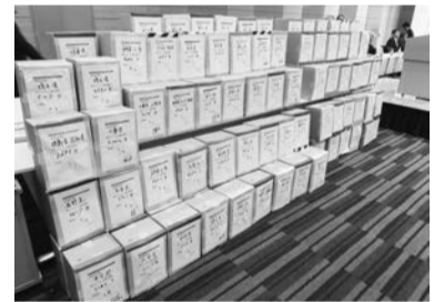
うず高く積まれた50万筆の署名

全場の衆議院第一議員会館には、全国から188人が参加、三重建労からは3人が参加しました。連続して行われた2つの集会には、合わせて5党・57人の国会議員が参加し、全建総連の運動に対する激励の挨拶をいただくとともに、約50万筆(被災者住宅支援署名14万8793筆、インボイス署名136万9753筆)の仲間の声を受け取っていました。 特に、消費税の複数税率導入に伴い、2023年10月から導入が予定されている「適格請求書等保存方式(インボイス制度)」について