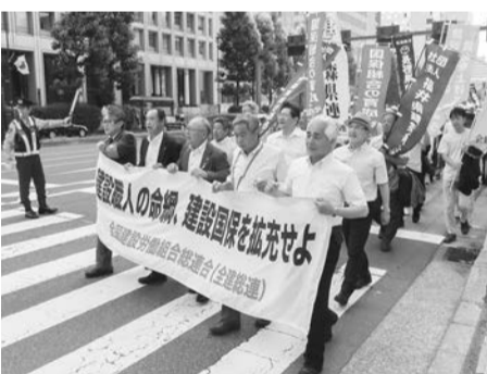
デモ行進で要求を訴える(都内)

では、免税事業者(基準期間の課税売上高が1000万円以下)が、課税事業者への転換を求められたり、取引から排除されたりする等の懸念があることから、全建総連では、インボイス制度の見直しを求めて、今後も運動の強化を図っていきます。