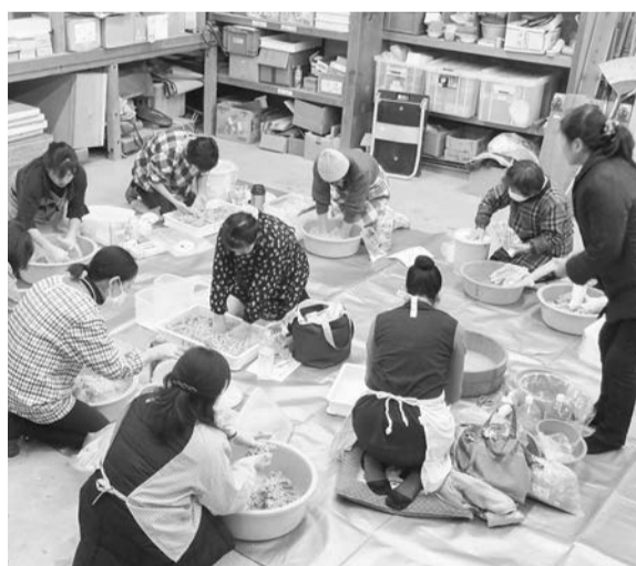
18人が会話を楽しみながら

書などの原始記録の保存は、税務調査対策の面からも重要です。組合では確定申告に備え、各支部で記帳学習会を開催し、組合員の記帳能力の向上を図りました。 本年から給与所得控除の縮小をはじめとする所得税制の大幅な改正が行われ、税制改正大綱も企業優遇が目立つ内容となっています。 三重建保では、今後も庶民に厳しい「大衆増税」には反対の立場で、全国の仲間と運動を進めていきます。