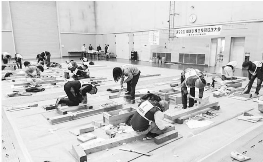
日頃の訓練の成果を競う